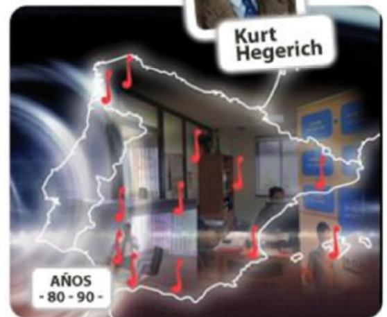
Vigo, Burgos, Zaragoza, Valencia, Barcelona, Sevilla, La Coruña, Granada, Málaga, Palma de Mallorca y Badajoz.

En paralelo, al final de los años noventa Claro Sol era, en la terminología del momento, un grupo "multi-servicio".